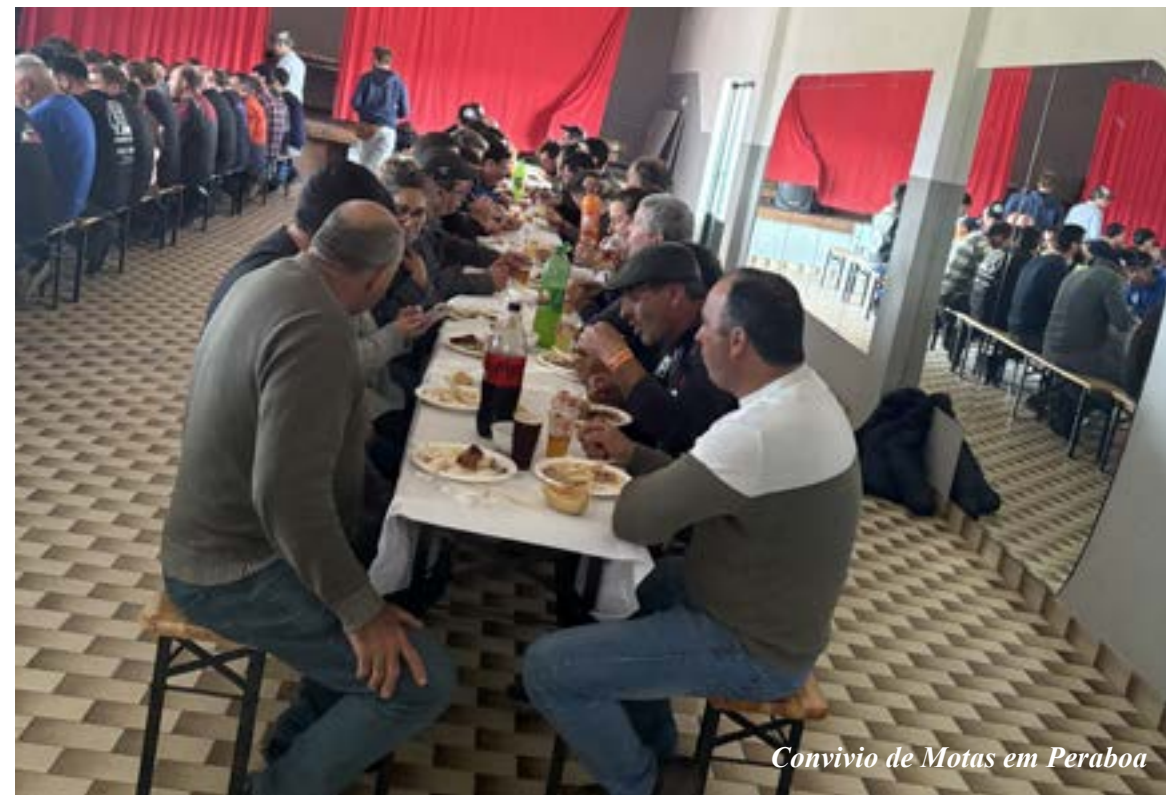
Convívio de Motas em Peraboa