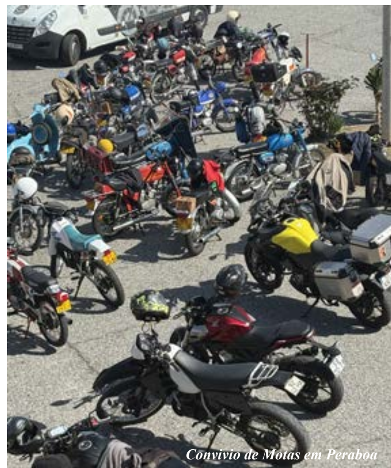
Convívio de Motas em Peraboa