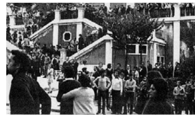
funeral de José Ribeiro Santos 1972

Foram recrutados e instruídos um corpo de vigilantes, os “go-