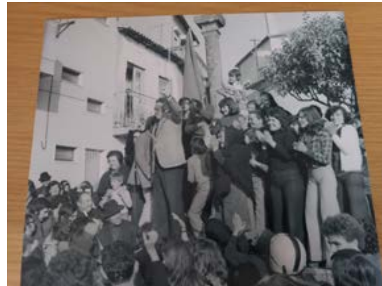
Mário Soares em Caria, em campanha para as Legislativas 1976

Votaram para a Assembleia Constituinte mais de 5,7 milhões de portugueses. Um valor histórico que constituiu uma clara demonstração de apoio da população ao regime democrático que se consolidava. Na primeira eleição