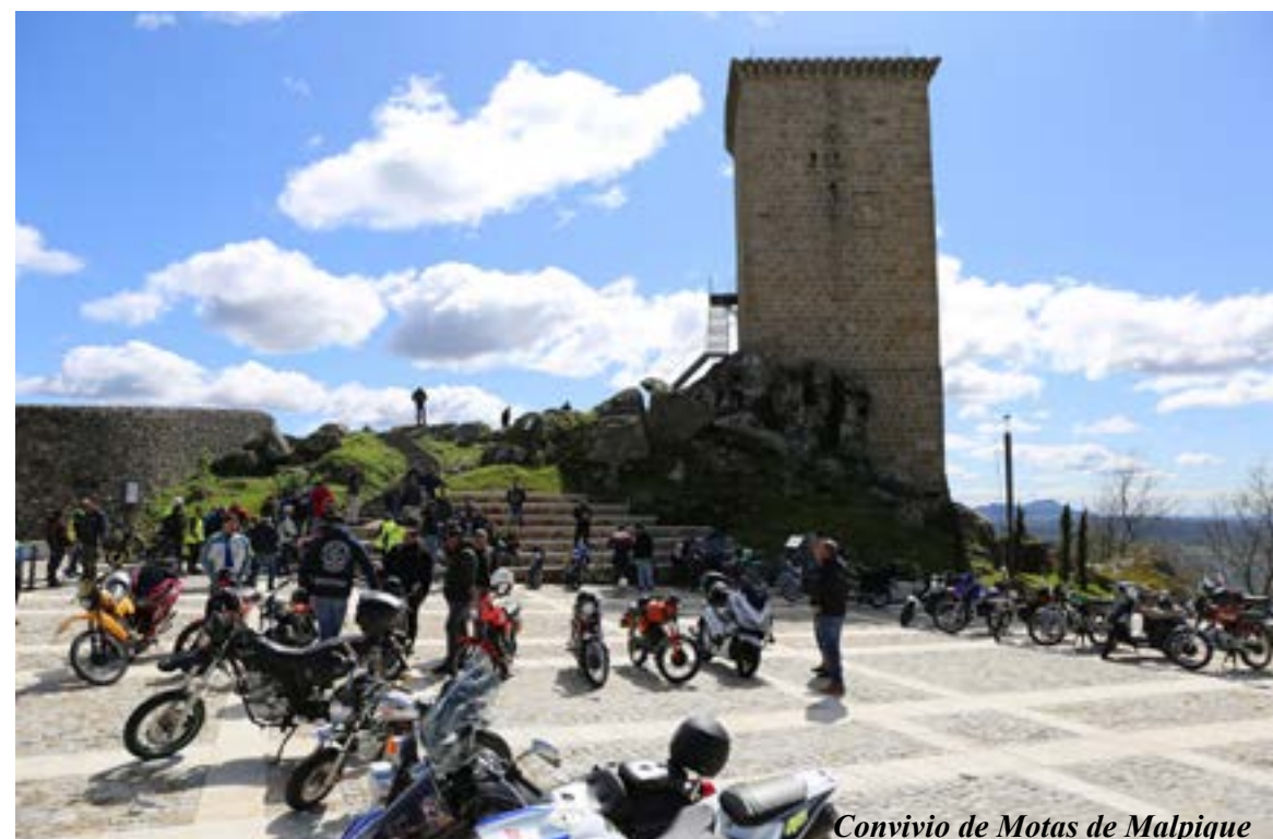
Convívio de Motas de Malpique