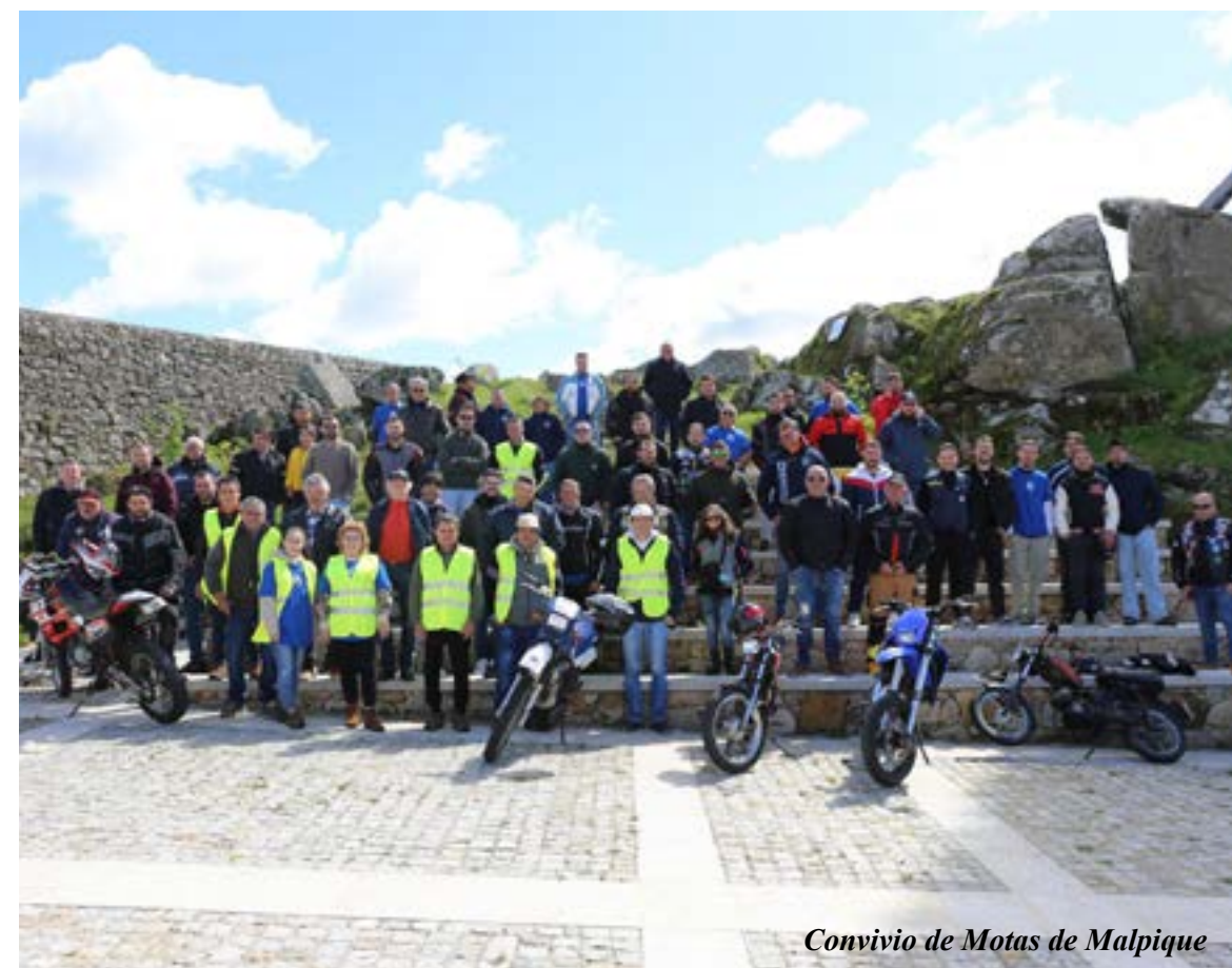
Convívio de Motas de Malpique