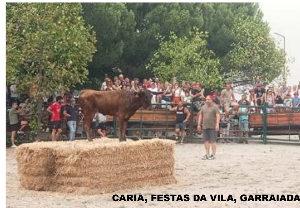
CARIA, FESTAS DA VILA, GARRAIADA