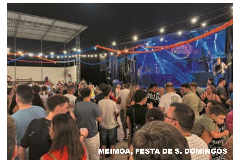
MEIMOA, FESTA DE S. DOMINGOS