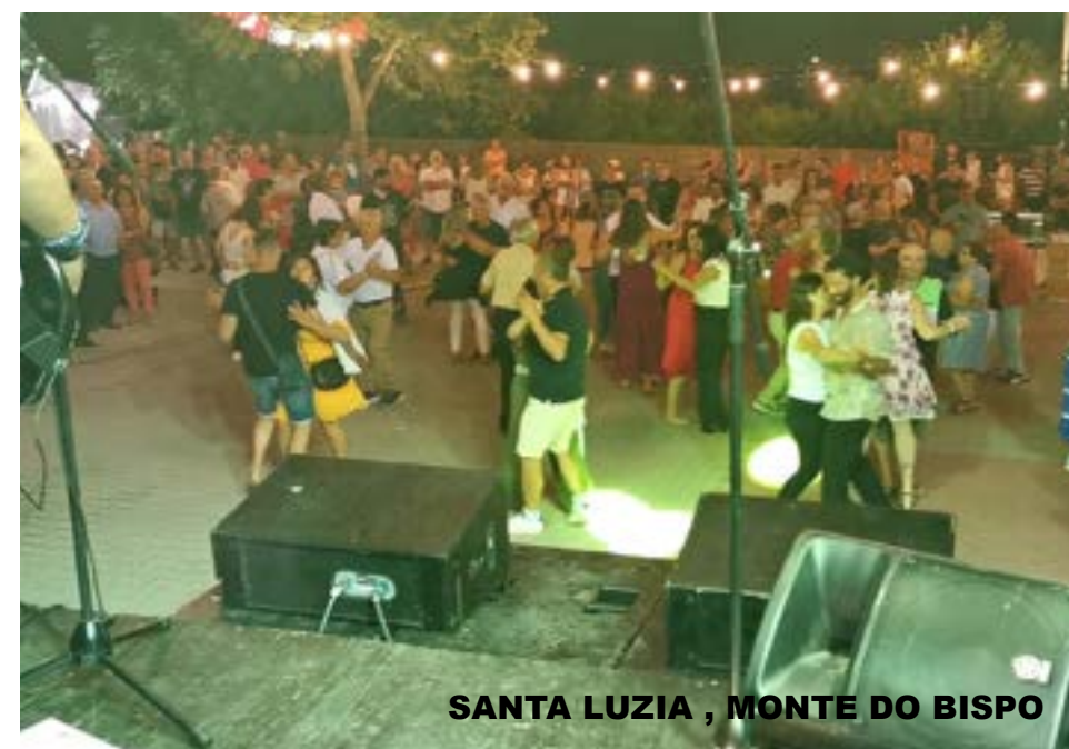
SANTA LUZIA , MONTE DO BISPO