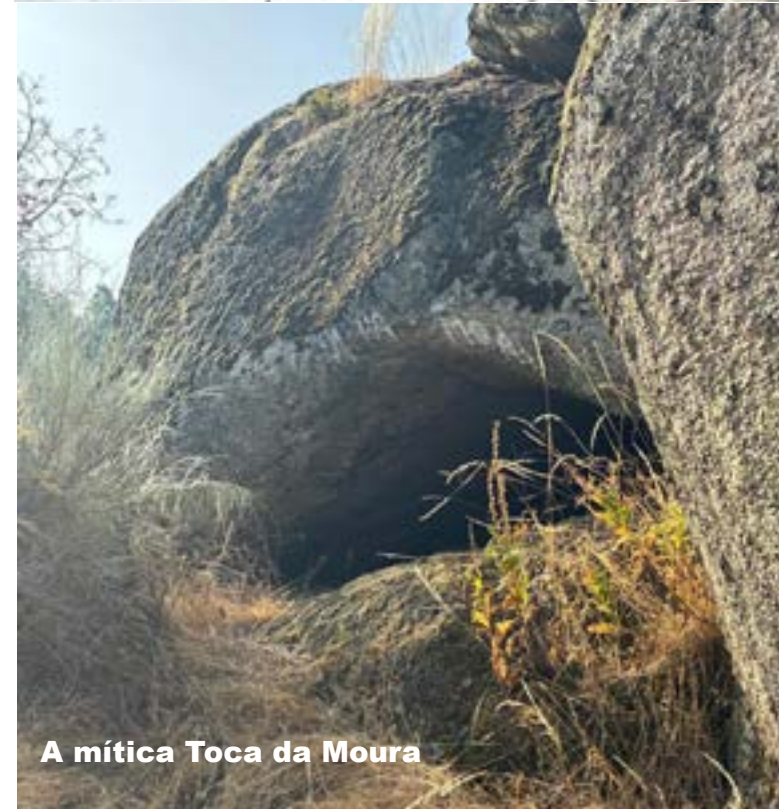
A mítica Toca da Moura

Caria foi ficando repleta, o fumo dissipou-se e o ambiente aliviou, o sentimento de festa e diversão, apoderou-se dos festeiros e foram lidados cinco soberbos animais da conceituada Ganadaria da Ana Sequeira. No mesmo ambiente prosseguiu a festa com Sons do Zêze-re; 2h DJ "Valelo". Tudo isto decorreu na ruas primorosamente adornadas e decoradas com o trabalho voluntário das "gentes" da terra.