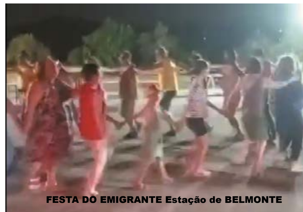
FESTA DO EMIGRANTE Estação de BELMONTE