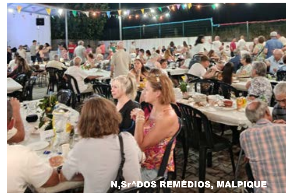
N, Sr. DOS REMÉDIOS, MALPIQUE