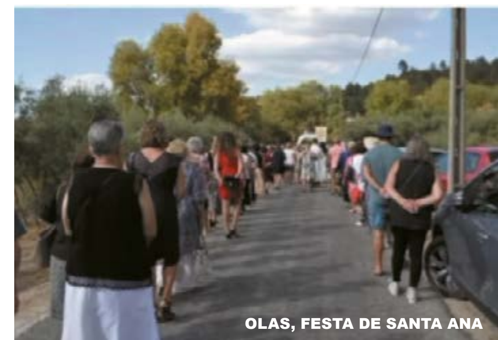
OLAS, FESTA DE SANTA ANA