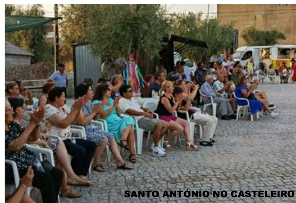
SANTO ANTÓNIO NO CASTELEIRO