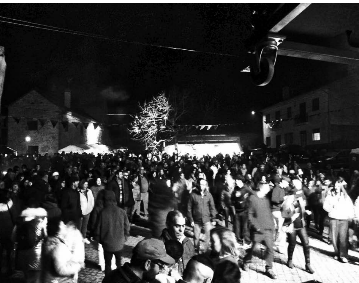
[Fig.07] O arraial depois do "sermão" (2023).