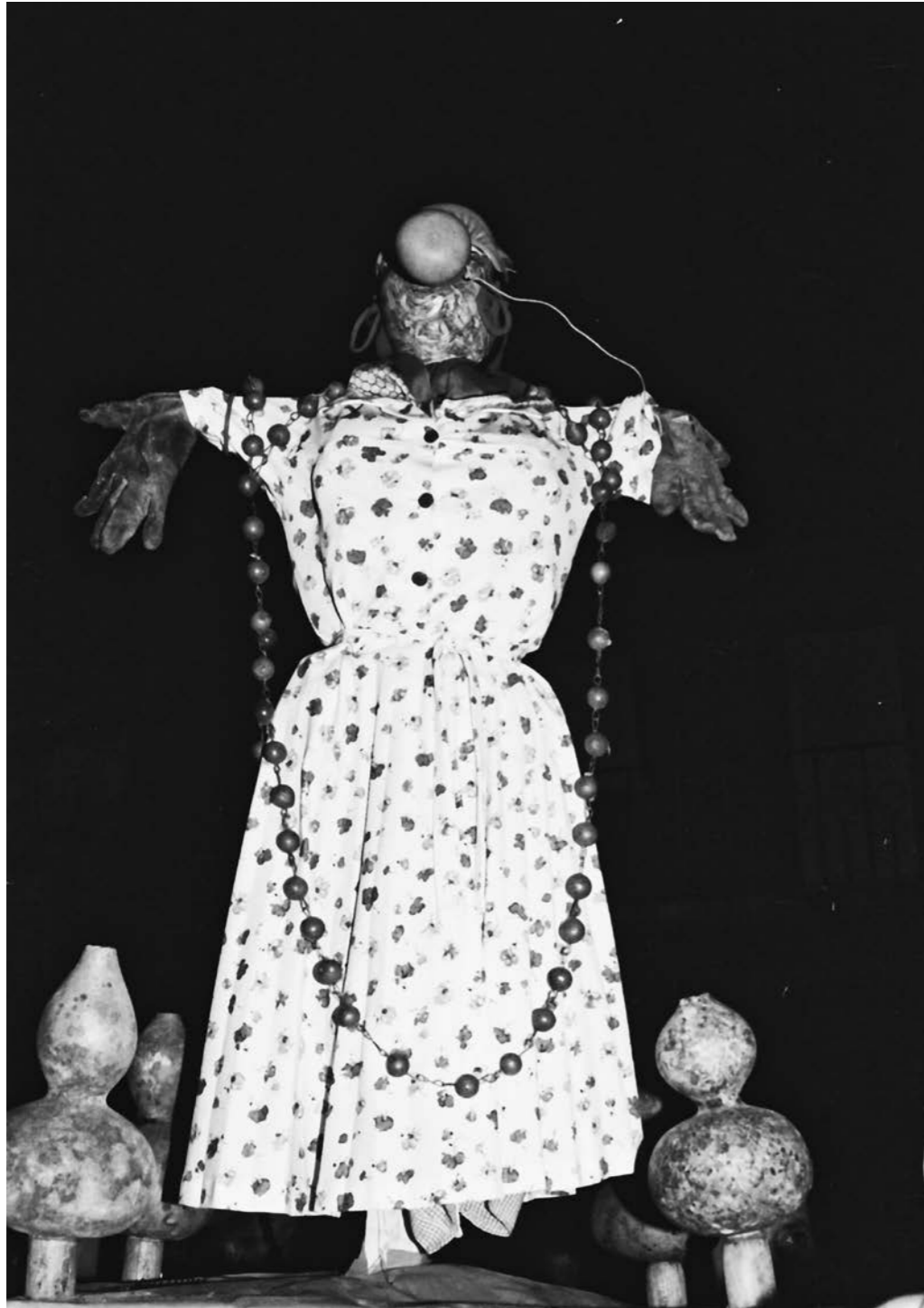
[Fig.02] Santa Bebiana representada por uma boneca de palha, em 1988. (foto: Mário Tomás).