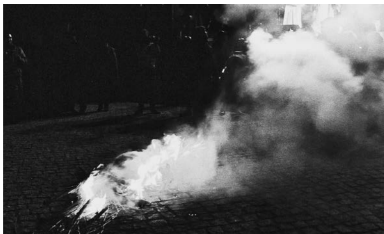
[Fig.08] Queima ritual do boneco de palha no largo da feira (2023), no largo da feira (2023).

variadas alterações/ inovações que confrontam e convocam múltiplas vozes nas proficuas discussões entre tradição e modernidade, ao longo dos tempos históricos festivos. Destes sucessivos (des)encontros entre a tradição e modernidade, percebemos imediatamente a dimensão desta enorme riqueza patrimonial dos seus elementos mais caracterizadores: as alternâncias rituais dos protagonistas dos "sermões" e seus repertórios, as mudanças nas dramaturgias, mais concretamente em torno da figura da Santa Bebiãna e do S. Martinho (de bonecos de palha ritual a manequins), a presença de elementos relacionados com o vinho, a participação de género que se foi alterando com a implicação cada vez mais vincada das mulheres na organização e preparação da festa, a programação com tudo aquilo que se foi inovando, mas também com tudo aquilo que foi perdendo destaque. No fundo, é compreender com profundidade o devir da festa, esse acréscimo de discussões proporcionadas pelos processos de mudanças culturais e sociais que acompanham a festa merecem a maior das atenções.