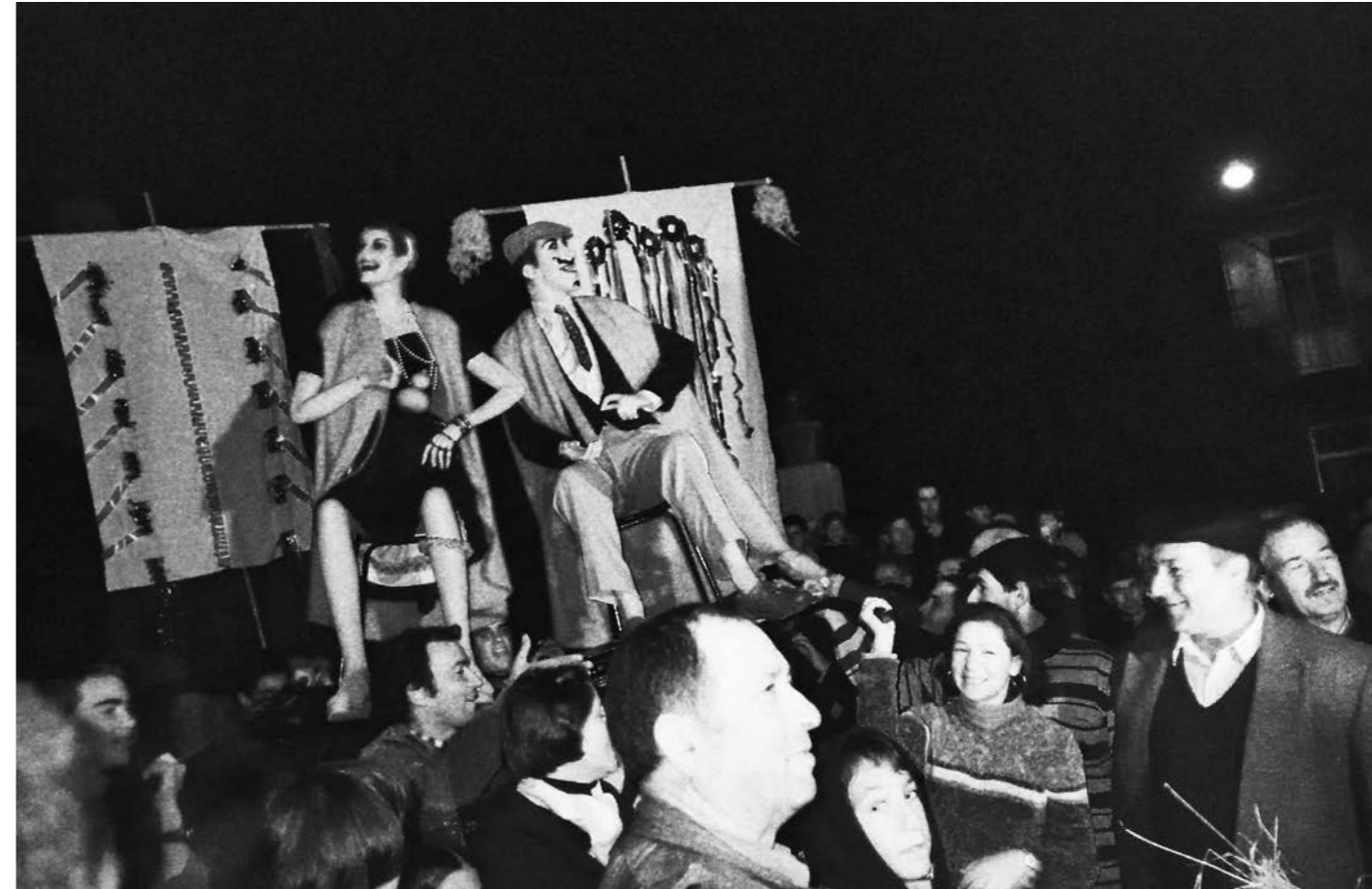
[Fig.03] Santa Bebiana e S. Martinho representados por manequins, em 2001.

Não foi possível conhecer em que ano terá sido adicionada à festa de Santa Bebiana a refeição comunitária oferecida à população, uns anos pela Junta de Freguesia de Caria, e outros pela Câmara Municipal de Belmonte.